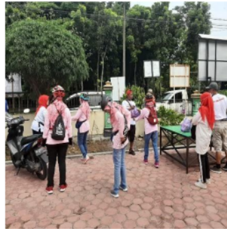
Photo 2. Penurunan sembako dari BUS kampus