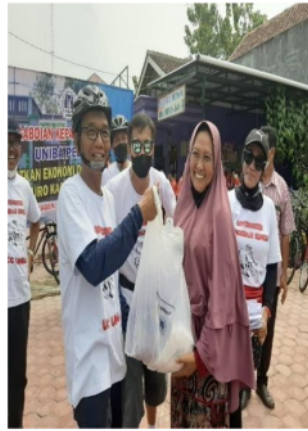
Photo 14. Penyerahan sembako dari tokoh masyarakat