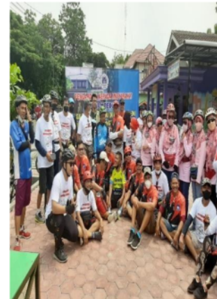
Photo 15. Kebersamaan dengan masyarakat pada pengabdian masyarakat

Kebersamaan antara dosen, karyawan dan masyarakat sekitar dalam pelaksanaan pengabdian pada masyarakat sangat terasa. Hal ini menunjukkan bahwa dukungan yang luarbiasa ditunjukkan. Pengorbanan waktu, tenaga dan financial menjadi bukti keseriusan dan pelaksanaan demi suksesnya penyelenggarakan pengabdian masyarakat oleh UNIBA Surakarta tahun 2021.