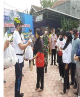
Photo 9. Penyerahan sembako kepada masyarakat

Fungsi Universitas khususnya Universitas Islam Batik Surakarta dalam menerapkan tri dharma perguruan tinggi sangatlah penting. Fungsi universitas sebagai lembaga pendidikan memiliki tugas pokok melaksanakan proses pendidikan dan pengajaran, serta melaksanakan penelitian dan pengabdian masyarakat. Pengabdian masyarakat adalah suatu gerakan proses pemberdayaan diri untuk kepentingan masyarakat. Adapun pelaksanaan kegiatan pengabdian dapat membawa perubahan kepada masyarakat yang lebih baik.