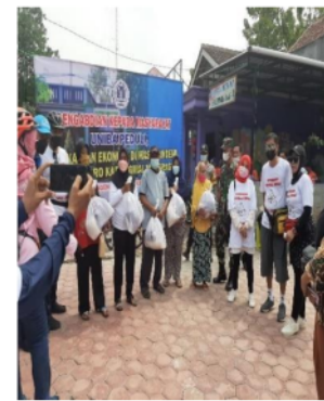
Photo 12. Penerima sembako