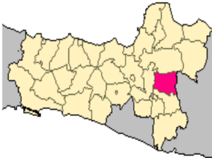
Peta wilayah kabupaten Sragen

daerah pegunungan kapur yang membentang dari timur ke barat terletak di sebelah utara bengawan Solo dan dataran rendah yang tersebar di seluruh Kabupaten Sragen, dengan jenis tanah : gromusol, alluvial regosol, latosol dan mediteran. Iklim Kabupaten Sragen mempunyai iklim tropis dan temperatur sedang dengan curah hujan rata-rata dibawah 3.000 mm/tahun dan hari hujan dengan rata-rata dibawah 150 hari/tahun ( https://www.sragenkab.go.id/tentang-sragen.html ).