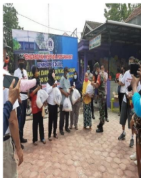
Photo 10. Penyerahan sembako dari Babinsa