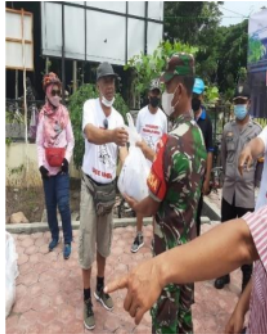
Photo 7. Penyerahan sembako secara simbolis ke Babinsa