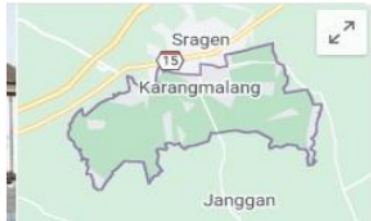
Peta kecamatan Karangmalang

Jumlah Penduduk: 9554 jiwa. Jumlah KK: 2897 KK. Kondisi Tanah: Gromosol. Curah Hujan: 2500 mm/tahun. Hari Hujan: 90 hari/tahun. Potensi Tanah: Pertanian Irigasi ( http://www.puro-sragen.desa.id/index.php/monografi-desa/ )