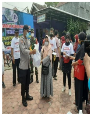
Photo 11. Penyerahan sembako dari kepolisian