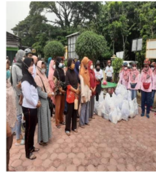
Photo 6. Peserta penerima sembako desa Puro