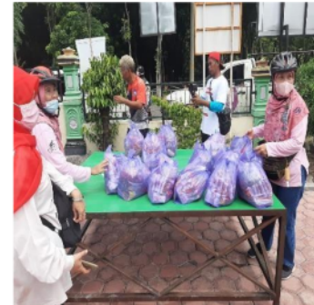
Photo 3. Menyiapkan bahan sembako di meja