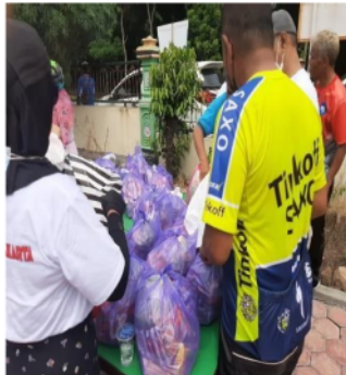
Photo 4. Menyiapkan bahan sembako dibantu masyarakat

Semangat masyarakat yang luar biasa dalam kegiatan pengabdian pada masyarakat di desa Puro kabupaten Sragen. Demikian juga masyarakat sekitar dan komitmen tinggi aparat pemerintah. Hal ini menunjukkan bahwa kegiatan pengabdian masyarakat oleh UNIBA Surakarta ini mendapatkan dukungan dari berbagai pihak dan tepat sasaran.