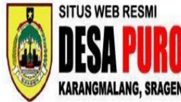
Lambang desa Puro