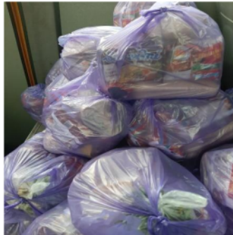
Photo 1. Bahan sembako disiapkan di kampus UNIBA