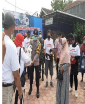
Photo 8. Penyerahan sembako secara simbolis kepada kepolisian