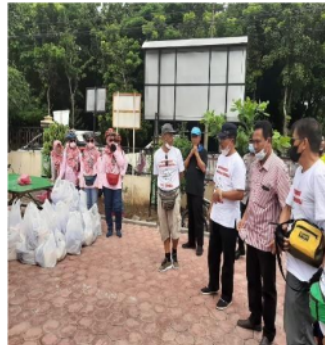
Photo5. Sambutan dari Aparat kelurahan Puro